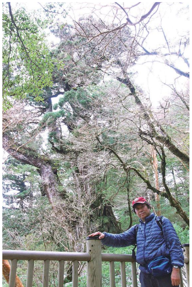
世界自然遺産登録地 屋久島 屋久杉 縄文杉 樹齢7,200年 見学