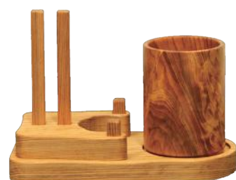
屋久杉コップセット