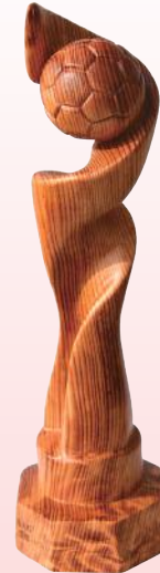
屋久杉 トロフィー