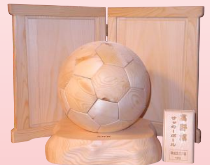
高野槇サッカーボール