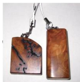
屋久杉泡瘤ストラップ