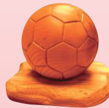
ケヤキ サッカーボール