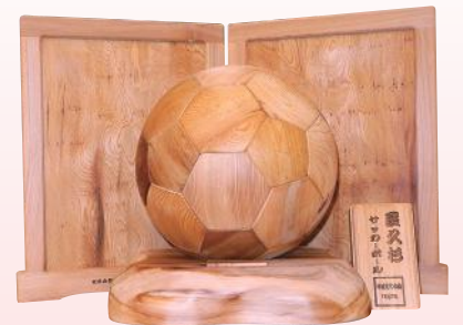
屋久杉サッカーボール