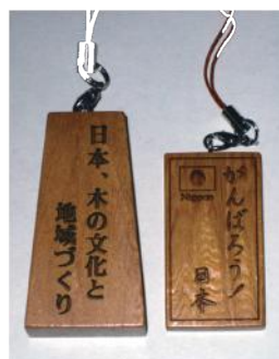
屋久杉ストラップ