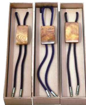
屋久杉ループタイ