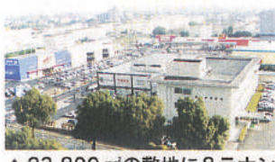
▲23,800㎡の敷地に8テナントが出店している(右手前は熊本東税務署)