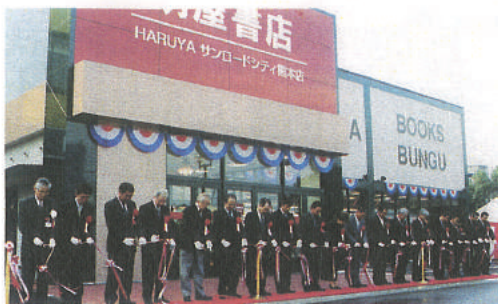
▲来賓など18人が、同社直営の明屋書店前でテープカットに臨んだ