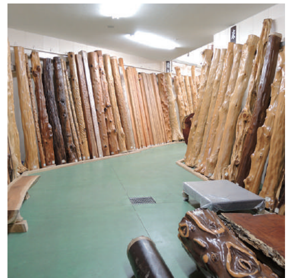
床柱 乾燥材 屋久杉、カエデ(楓)、ユス(柞)、アララギ(イチイ 一位)、イヌマキ(犬槲)