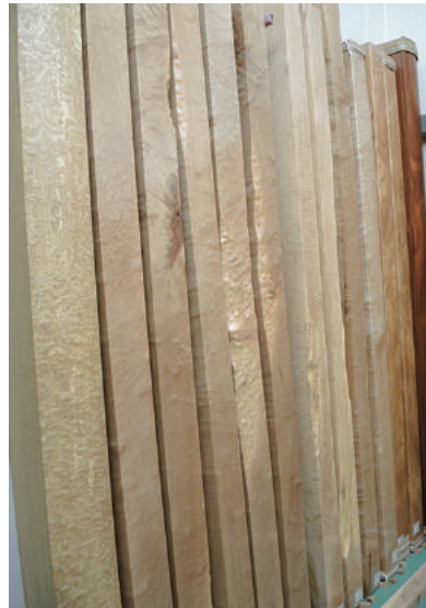
床柱 乾燥材 カエデ(楓)玉空、センダン(栴檀)、アララギ(イチイ 一位)、ユス(柞)、その他