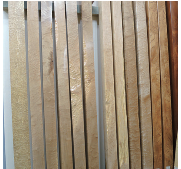
床柱 乾燥材 カエデ(楓)玉空、センダン(栴檀)、アララギ(イチイ 一位)、ユス(柞)、その他