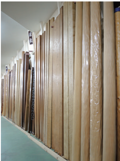
床柱 乾燥材 ユス(柞)、アララギ(イチイ 一位)、マツ(松)、ピンガ、クワ(桑)、カエデ(楓)、スギ(杉)、その他