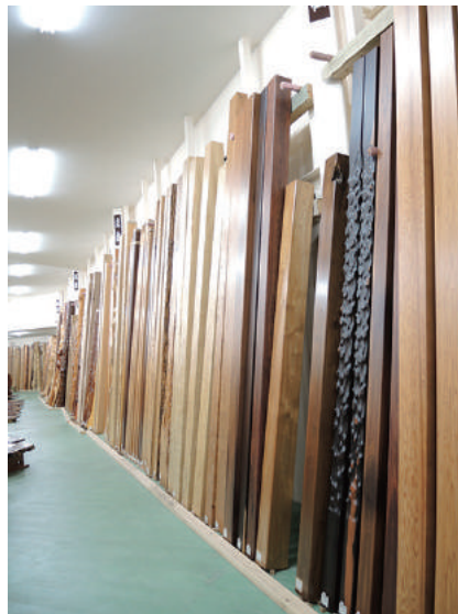
床柱 乾燥材 クロガキ(黒柿)、タモ(栲)、ツガ(桐)、ピンガ、コクタン(黒檀)、その他