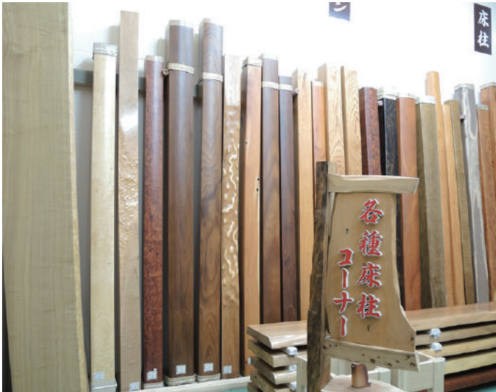
床柱 乾燥材 カエデ(楓)、コクタン(黒檀)、クワ(桑)、ピンガ、ケヤキ(欒)、マツ(松)、タモ(栲)、外材、その他

床柱は床の間が一番目立つ柱といえます。床柱コーナーには約1,000本あり高さ3m以上です。樹種はまず屋久杉に始まり、カエデ(楓)、クロガキ(黒柿)、クワ(桑)、ケヤキ(欒)、アララギ(一位)、サクラ(桜)、ツガ(桐)、タモ(栲)、マキ(槇)、ユス、コクタン(外材)その他となります。床柱は近年住宅には使われているのが減少しておりますが、床柱は家の中で中心的な存在感があります。やはり住宅には床柱がないと落ち着かなく安らぎがありませんので、近い将来また必ず床柱が使われることが増えてくると思います。店舗の中にも目立つ場所に飾り柱として使っただけであれば店舗も生き生きとします。弊社、神城文化の森藤田株式会社の床柱は普通は見られない玉空や縮空でさらに人工乾燥ではなく、天然乾燥で10年以上乾燥した価値あるものばかりです。なかなか全国でもお目にかかれぬものばかりですし、何よりもたくさんの数の中から自分の好みで選択することができますので是非ともご利用くださいませ。