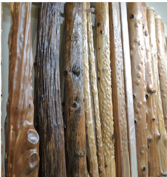
床柱 乾燥材 ユス(柞)、屋久杉、その他