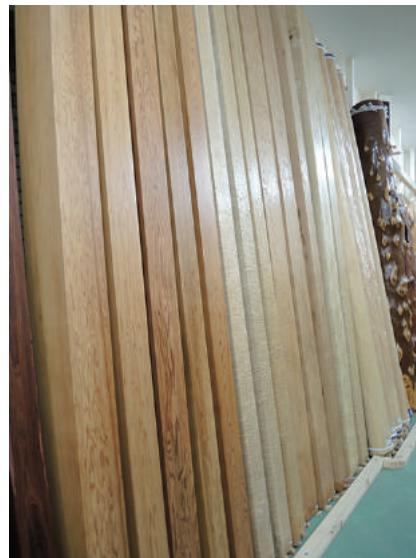
床柱 乾燥材 タモ、アララギ(イチイ)、屋久杉、ツガ(桐)、その他