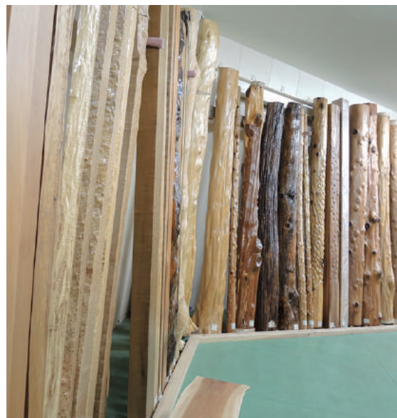
床柱 乾燥材 屋久杉、イヌマキ(犬槲)、マツ(松)、ユス(柞)、その他