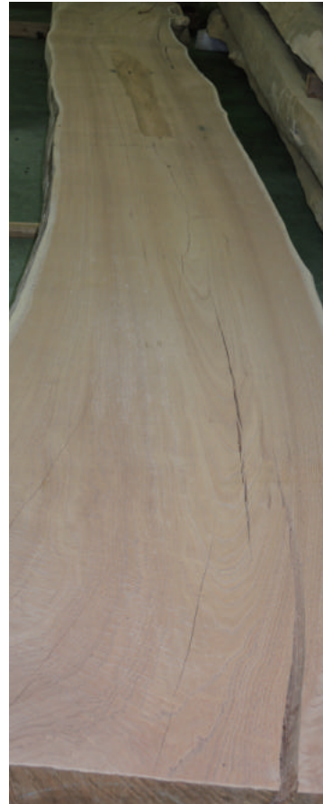
センダン 長さ4m50cm 厚み38cm 幅50cm