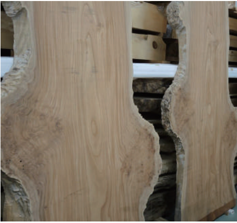
ケヤキ (櫟) コブ