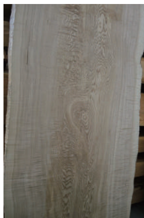
盤木 タモ (栂) 玉空