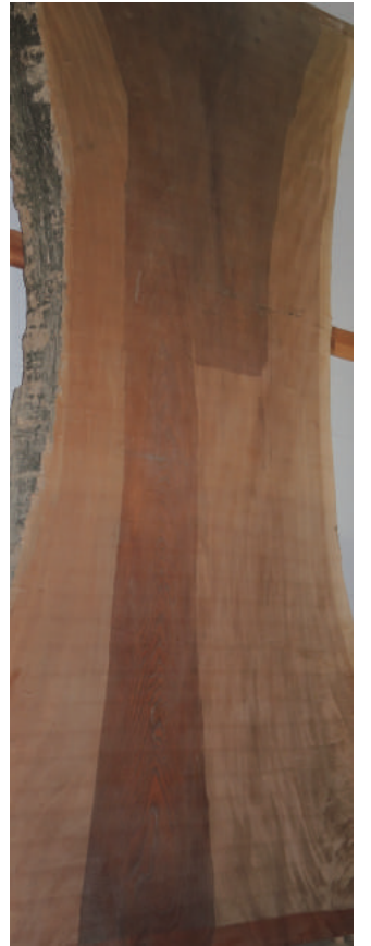
ケヤキ(櫟) 高さ7m 幅1m50cm 天然乾燥材10年 裏無地