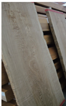
盤木 タモ (栂) 玉空