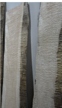
盤木 タモ (栂) 玉空 10枚あります