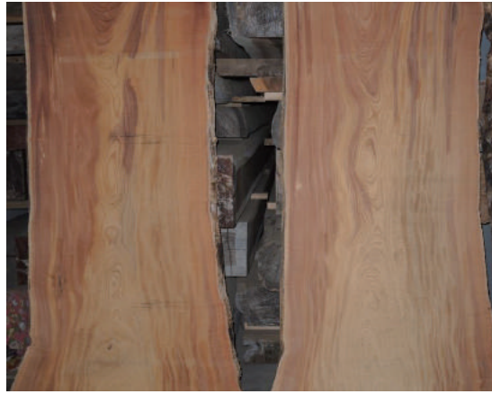
ケヤキ (櫟) 玉空 高さ2m 天然乾燥1年未満