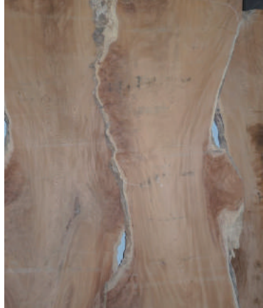
ケヤキ (櫟) 玉空 3m 天然乾燥5年