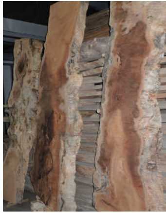
ケヤキ (櫟) 玉空 高さ4m 天然乾燥1年未満