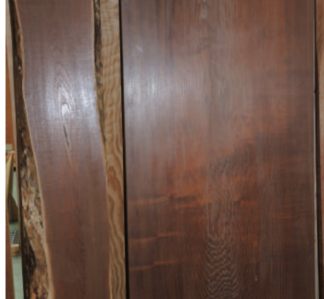
クワ 特上 天然乾燥30年