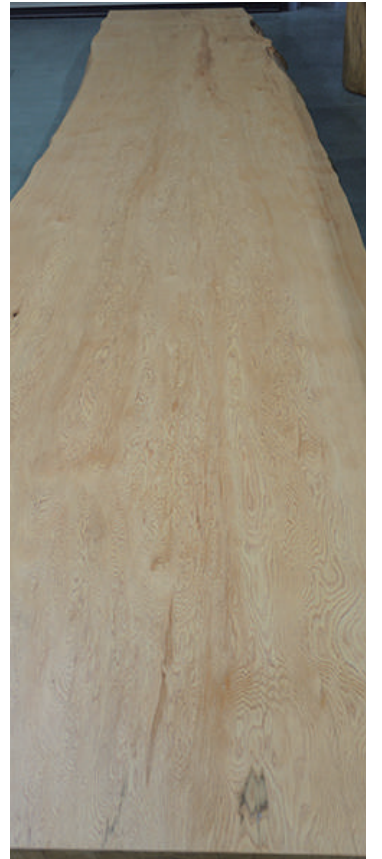
盤木 ラオスのヒノキ (桧) 上等 長さ6m10cm 幅1m30cm 天然乾燥10年