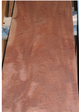
盤木 ケヤキ (櫟) 玉空