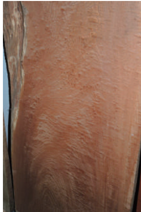
盤木 ケヤキ (櫟) 玉空