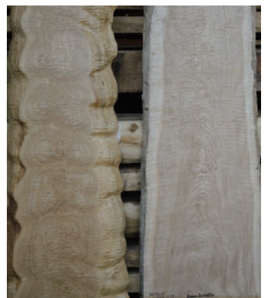
盤木 タモ (栂) 玉空 10枚あります