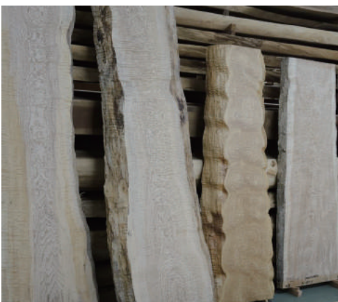
盤木 タモ (栂) 玉空 10枚あります