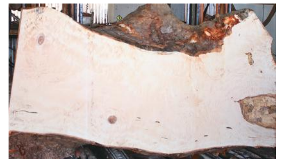
トチの木 長さ4m40cm 末口64cm・元口1m20cm