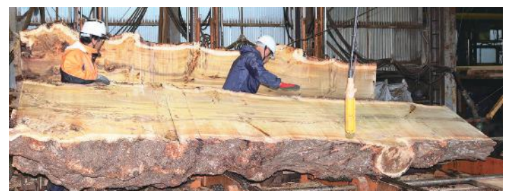
ポプラ(杓入り) 長さ4m30cm・末口70cm・元口1m