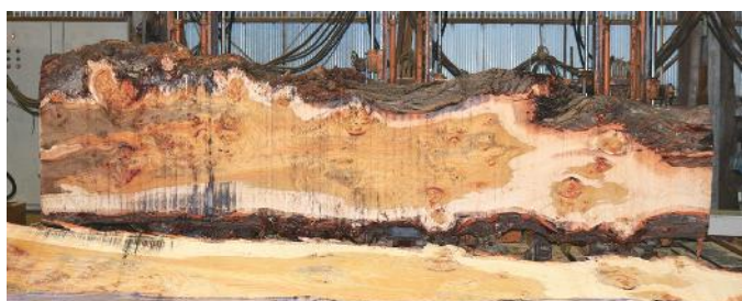
ポプラ(杓入り) 長さ4m30cm・末口70cm・元口1m