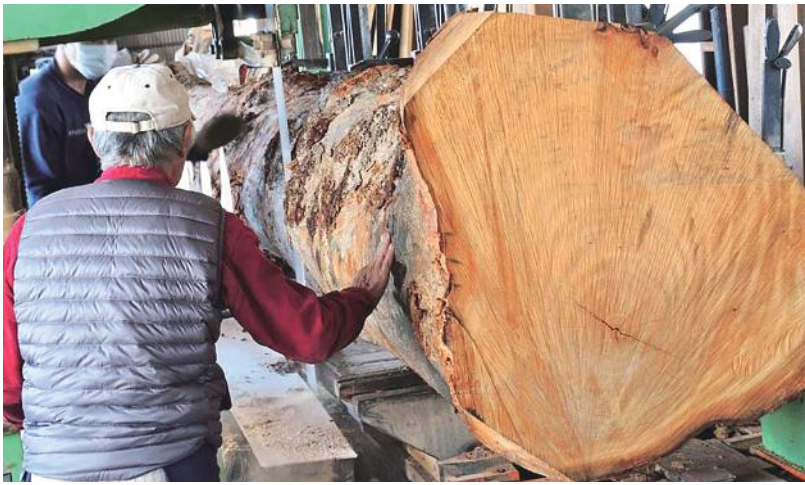
ケヤキ コブ木 製材