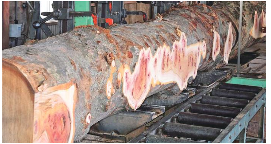
ケヤキ コブ木 製材