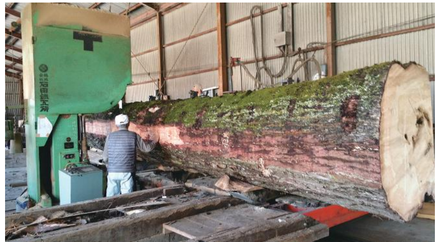
イチョウ 原木(樹齢300年・長さ8m・幅1m)・・・布勢神社(ふせ) 社木(熊本県山都町島木4 1 6 2番) 平成29年4月3日(月)