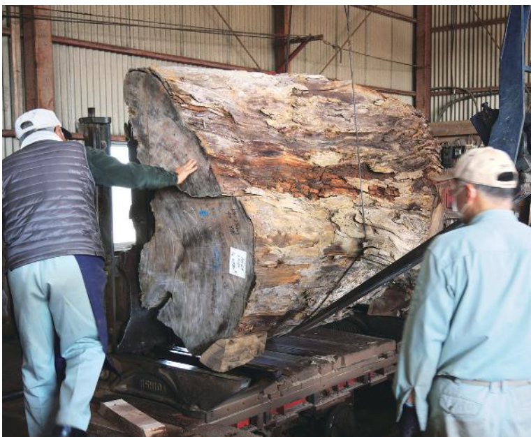
平成29年3月18日(土) 屋久杉 原木 製材