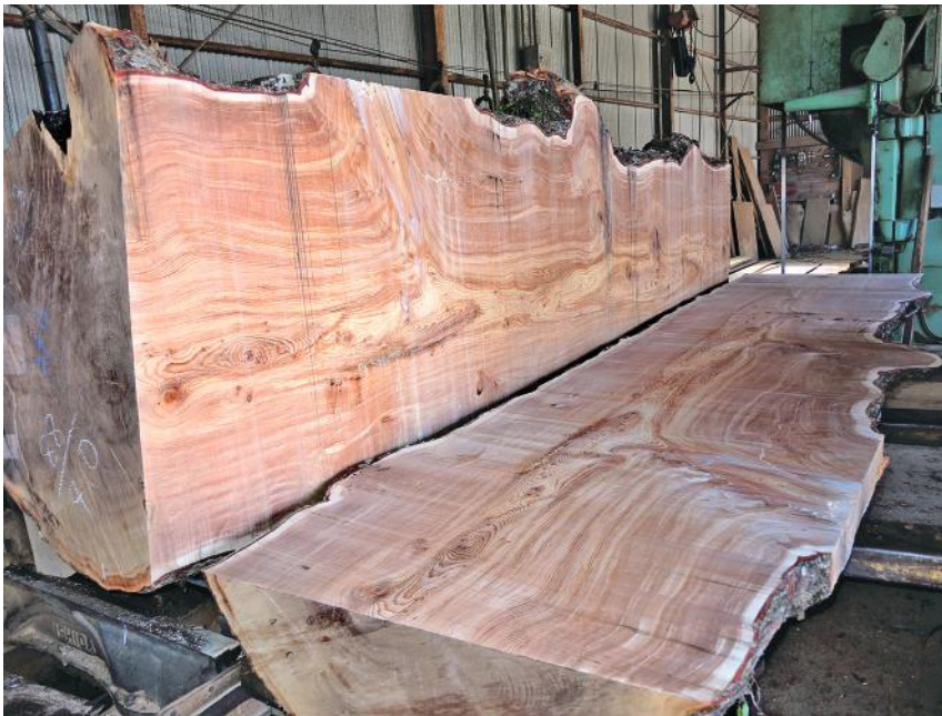
平成29年10月6日(金) 鹿児島県屋久島産 屋久ツガ 樹齢1,000年 (長さ6m・幅1m)