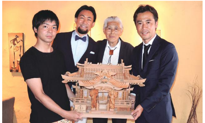
株式会社リッチフィールド (Ohana) 〒860-0801 熊本市中央区安政町5-17 クリスタルパレス2F 谷口 智矢 様・西村 考広・藤田 勲・藤田 俊哉