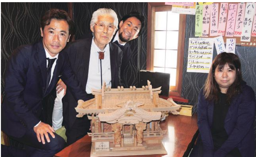
もぐり漁師の店 天草海士宴 〒860-0806 熊本市中央区花畑町13-17 西銀座通・甚兵衛ビルBF 藤田 俊哉・藤田 勲・西村 考広