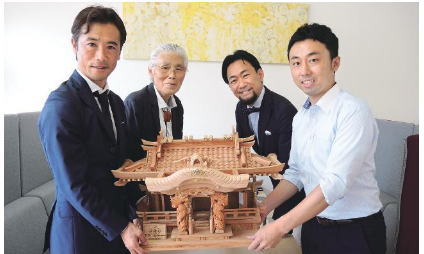
ほり司法書士事務所 〒861-8039 熊本市東区長嶺南5丁目2番7号 藤田 俊哉・藤田 勲・西村 考広・司法書士 堀 拓郎 様