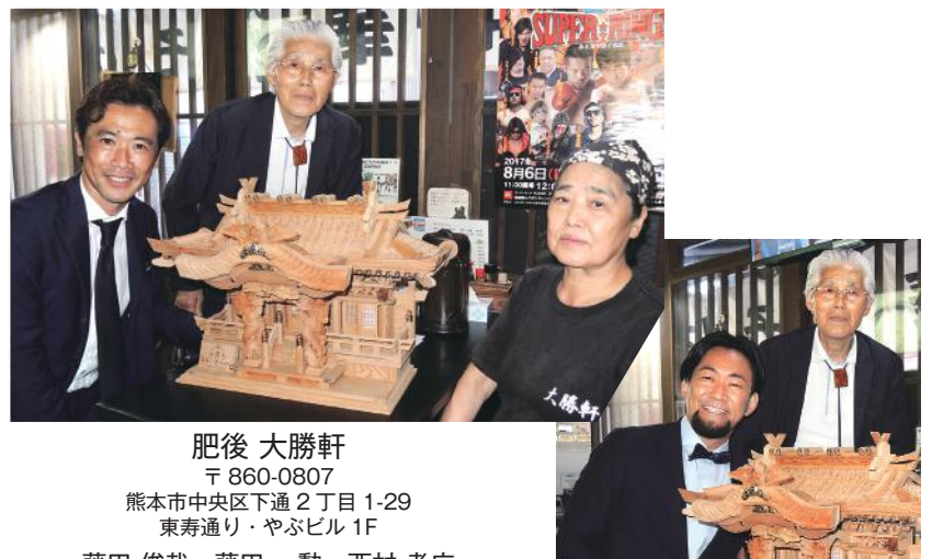
肥後 大勝軒 〒860-0807 熊本市中央区下通2丁目1-29 東寿通り・やぶビル1F 藤田 俊哉・藤田 勲・西村 考広