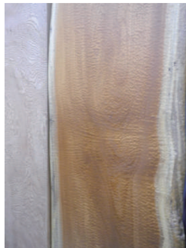
盤木 ケヤキ(樺) 玉杓