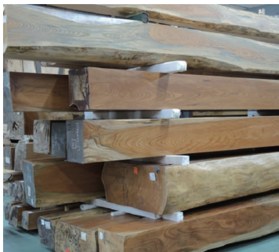
盤木 ケヤキ(樺) 盤木 天然乾燥20年以上