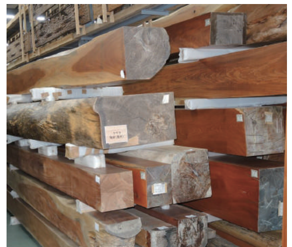
盤木 ケヤキ(樺) 天然乾燥20年以上