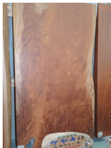
盤木 ケヤキ(樺) 玉杓