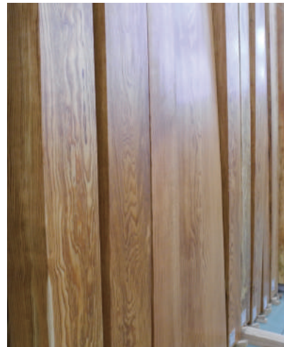
クロマツ 天然乾燥20年