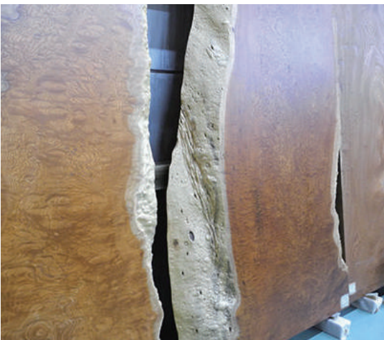
盤木 ケヤキ(樺) 玉杓