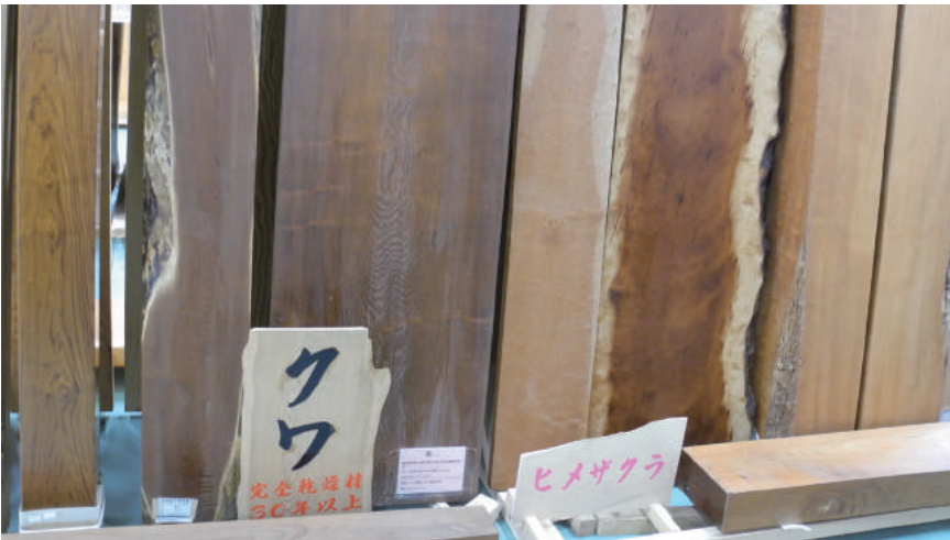
盤木 クワ(桑) 杓入り 他

神城文化の森では屋久杉をはじめ多数の盤木を取り揃えております。ラオスからのヒノキ(桧)など外材(輸入木材)などもあり大変豊富な数です。トラ杓、玉杓など個性的なものまで様々でございます。天然乾燥10年以上です。