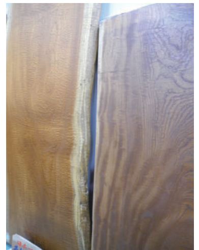
盤木 ケヤキ(樺) 玉杓