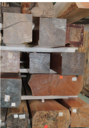
盤木 ケヤキ(樺) 盤木 天然乾燥20年以上