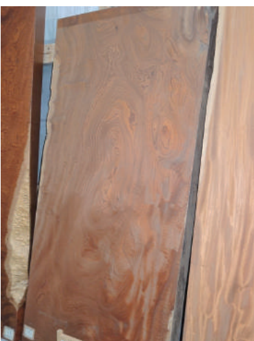
盤木 ケヤキ(樺) 玉杓