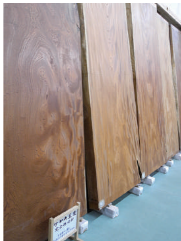
盤木 ケヤキ(樺) 玉杓